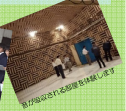
音が吸収される部屋を体験します