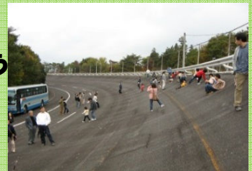
かなりの傾斜です。バスで高速走行します （試験走路）