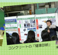
コンクリートの「健康診断」