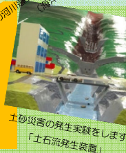
津波の河川模型に関する実験施設をご覧いただけます 「土石流発生装置」