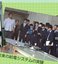
未来の給電システムの実験