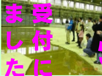
津波の河川遡上に関する実験施設を体験します（海洋沿岸実験施設）