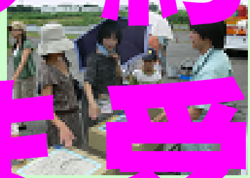
いろいろな舗装を試し、舗装の感触を体験します（舗装走行実験場）