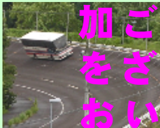
バンクを時速100km以上で走り抜けます（試験走路）