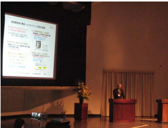
写真1 インデクシング発表