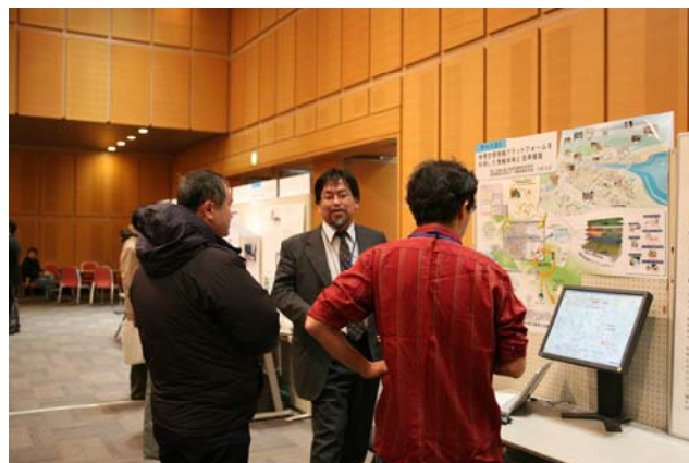
写真2 ポスター展示