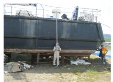
打ち上げられた船舶 (Tacroban 港)