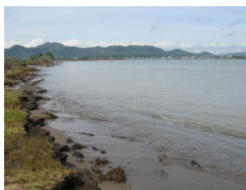
高潮により侵食を受けた砂浜 (Tacroban 空港)