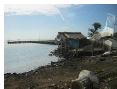
浸食された海岸と被災した倉庫 (Estancia 港)