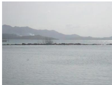
沖合に堆積した流出物 (Culasi 港)