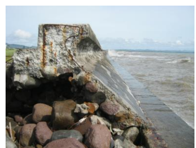
高潮により破断した海岸護岸 (Tacroban 空港)