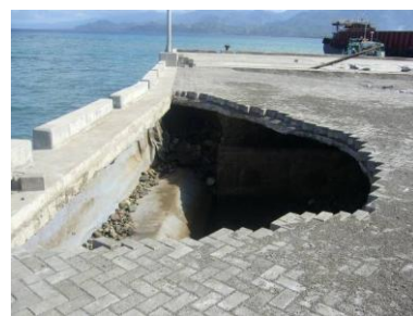
岸壁の吸出し (Lipata 港)