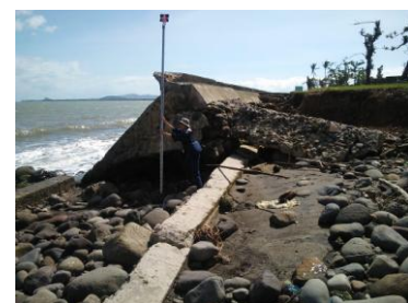
被災護岸の天端高さを測量 (MacArthur 公園)