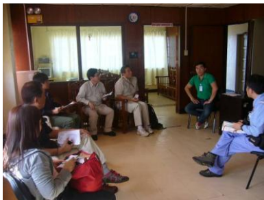
事務所でのヒアリング (Estancia 港)