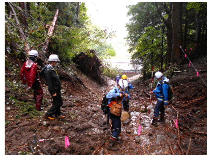
現地調査の状況（8月17日）