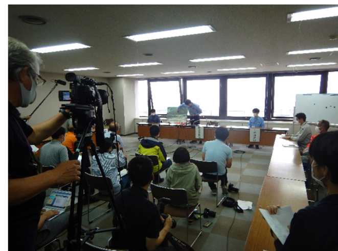
記者への説明（8月17日）