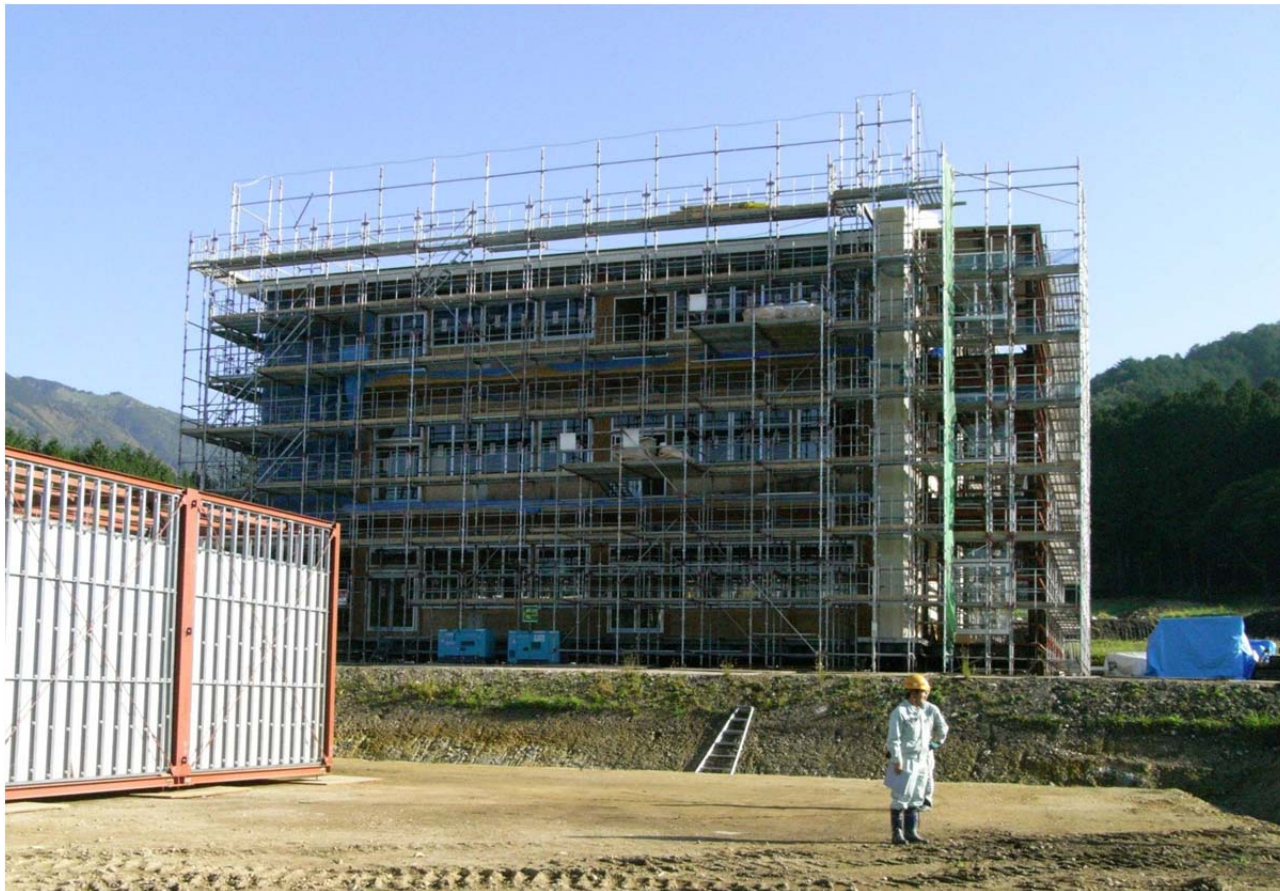
<建設中の試験体建物（平成 24 年 10 月時点）>