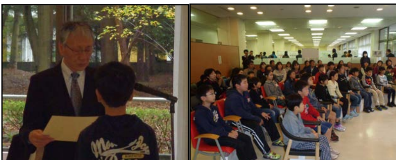
表彰状授与式の様子