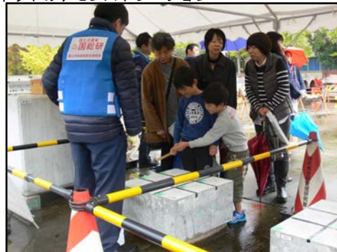
橋の撤去部材展示