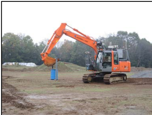
無人ショベルカーを動かせ！

バスによる走行体験(全長約6.2kmの試験走路)とITSスポットのデモンストレーション