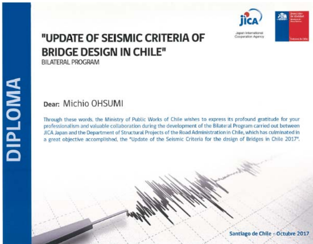
それぞれの専門家に新しい橋梁耐震基準の策定に関する感謝状が贈呈されました。