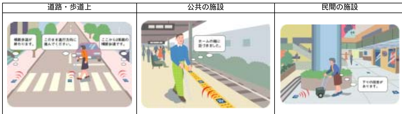
図 - 1 歩行者 ITS のサービスイメージ ~安全・安心の情報提供~