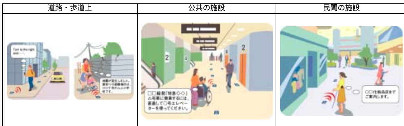
図 - 3 歩行者 ITS のサービスイメージ ~行き先までの案内~