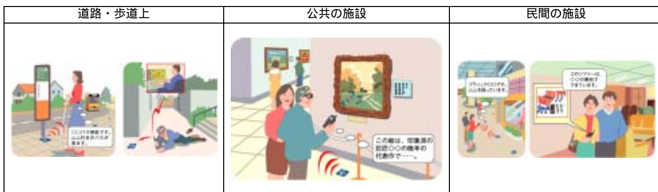
図 - 2 歩行者 ITS のサービスイメージ ~現在の場所の案内~