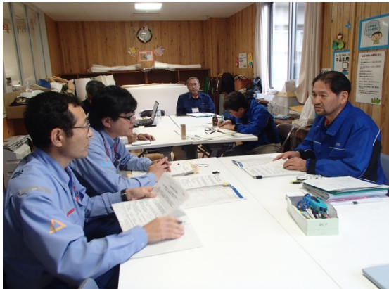
益城町長への緊急点検結果の報告