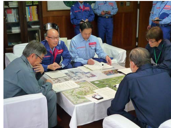
南阿蘇村長への緊急点検結果の報告