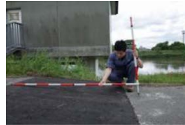
樋管周辺の抜け上がり 状況の調査

函渠の抜け上がりが生じるとともに、護岸部のはらみ出しが顕著に発生している箇所があることを確認。樋管下に連通が発生している可能性がある。早急な対応が求められる箇所を選定するとともに調査方法の提案を行った。