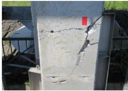
樋門の門柱の被災