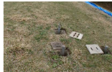
天端の沈下による堤体内水位観測孔パイプの浮き上がり