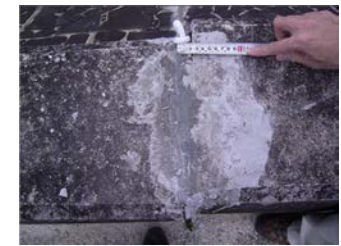
発泡スチロール系コーキング剤 による目地の補修