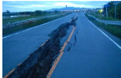
緑川右岸8.9k付近の変状