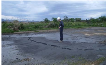
緑川左岸9.4k付近の噴砂