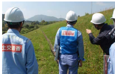
脇ダム堤体下流面状況(異状なし)