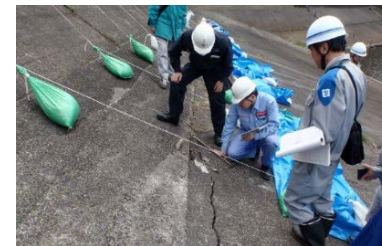
コンクリート遮水壁部クラック発生状況