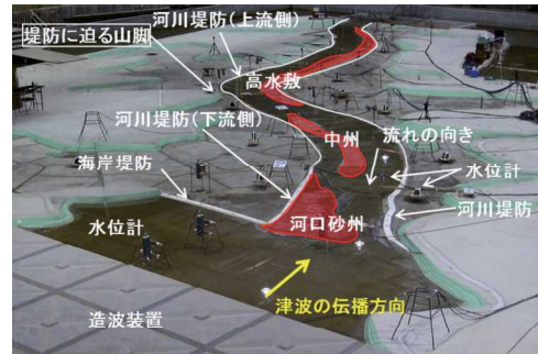
写真 模型実験水路の概観

砂州や高水敷を掘削すると津波が遡上しやすくなり、そのため、より上流でも水位が高くなると思われたが、実験の結果、必ずしもそうならず掘削前のほうが高くなる箇所が見られた。