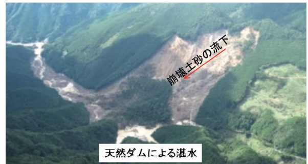
写真 2011年台風12号で生じた天然ダムの例

測箇所の流域面積の割合と流量観測箇所から天然ダムまでの距離に依存すると考えた。その上で、集水面積がある面積(限界面積)より大きく、流量観測箇所からの距離がある距離(限界距離)以内の範囲を天然ダムの形成監視可能区間とする手法を提案した(図)。