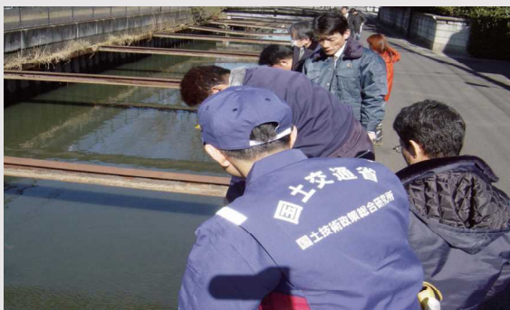
図 河川構造物TFによる鋼矢板護岸劣化状況調査

河川構造物TFは、技術・マネジメントの両面において河川維持管理をより高度化させること(発展)、さらには効果的・効率的な河川維持管理に係る最新の技術を現場に導入し、根付かせること(導入・定着)を全体目標に活動を行っている。