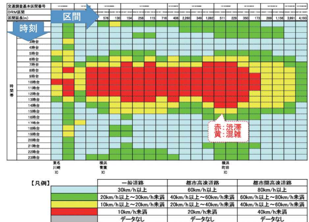
図2 時空間速度図の出力例(東名高速道路)