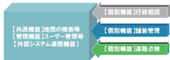
図-2 道路 Web マップの機能イメージ