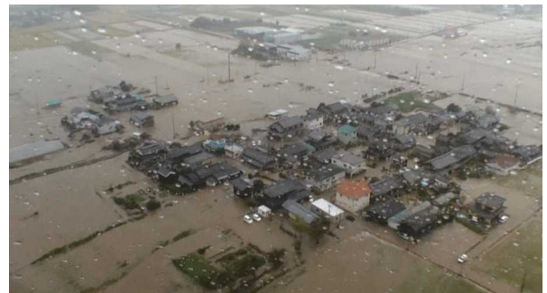
写真 鴨川の堤防決壊により浸水した集落

5時頃に鴨川右岸で堤防が決壊して周辺の集落が浸水し、床上浸水97戸、床下浸水76戸、一部損壊1戸の被害が発生した。なお、高島市全体の家屋被害は、床上浸水109戸、床下浸水176戸、一部損壊1戸であった。