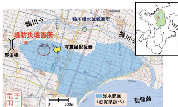
図-1 鴨川の位置と浸水範囲