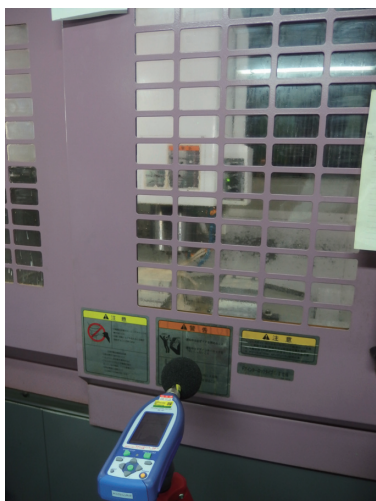
写真 まちなかものづくり事業所における騒音調査状況

まちなかものづくり事業所に在る製造用機器について、各種工程で用いられる汎用型・小型・低公害型の代表的な機器の大きさ、生産力、発生騒音等について、カタログ、ヒアリング等によりリスト化・分析を実施したが、発生騒音に関しては、必ずしも具体的数値が明らかではなかった。