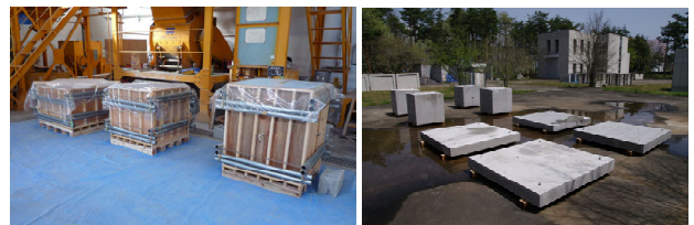
写真 1 製作したコンクリート試験体

また、コンクリートのトレーサビリティという観点からすれば、コンクリート硬化後に、具体の施工部分と固有の製造情報とが紐付く必要がある。しかし、生コンクリートは荷卸し時点では流動体である。そのため、製品表面に製造情報を記載した書面はもとより IC タグも貼付することはできない。