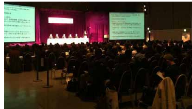
シンポジウム当日の様子

うした取り組みをきっかけに、さらに各事業者において、遊戯施設の運行の安全を高める取り組みが進められることを期待します。