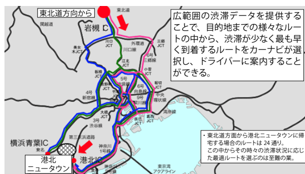
ダイナミックルートガイダンス