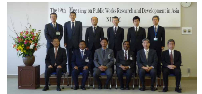
第19回アジア会議集合写真

・国総研 HP (国際活動) ( http://www.nilim.go.jp/lab/beg/foreign/kokusai/kokusaitekikatudou.htm )