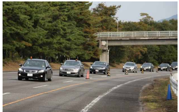
国総研試験走路での走行実験の様子

今年度は、ACC車または一般車が実際の道路交通環境で車間を一定に維持する走行や、キープレフトを遵守する走行を行ったときの周辺交通流への影響等を検証する公道走行実験を行うことで、より実現性の高いサービスを目指します。さらに、2013年に東京で開催予定のITS世界会議では、これら連携サービスをいち早く体験できる乗車デモを実施する予定です。