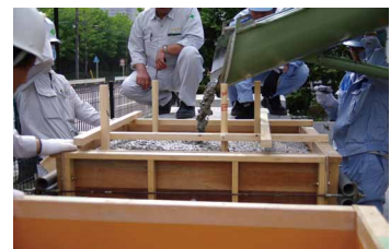
写真 3 生コン製造工場での実験の様子