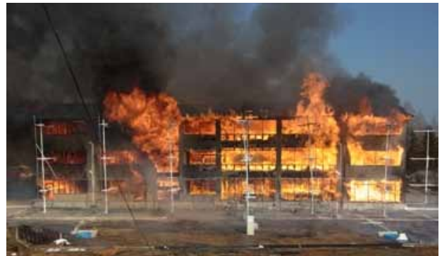
建物全体に火災が拡大した点火後34分時点の様子

今回の予備実験の結果を踏まえて仕様や実験方法を調整した上で、2012年度に基準化を想定した建物仕様による実大火災実験を行う予定です。