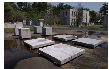
写真 2 実大試験体

http://www.nilim.go.jp/lab/idg/index.htm