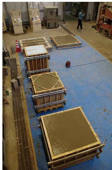
写真 1 作製中の実大試験体

まず、コンクリート内部に埋め込んだ IC タグの通信性能を確認する実験を、柱・スラブを模した実大試験体を作製して行いました。その結果、一般的に市販されている IC タグであっても、コンクリート表面から 25 ~ 30cm 程度の深さ以内であれば通信できることが分かりました。