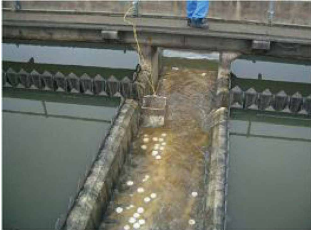
固形塩素による初期段階の消毒の状況

災害時に確保すべき下水道機能については、東日本大震災を受けて設置された「下水道地震・津波対策技術検討委