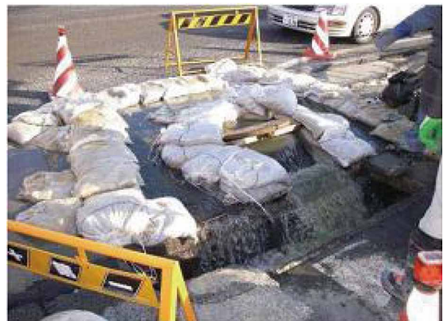
土のうを使用し近傍水路へ導水した事例

平成 23 年 3 月 11 日に発生した東日本大震災により 120 箇所もの下水処理場が被害を受け、特に岩手、宮城、福島各県の沿岸域に位置する多くの下水処理場、ポンプ場におい