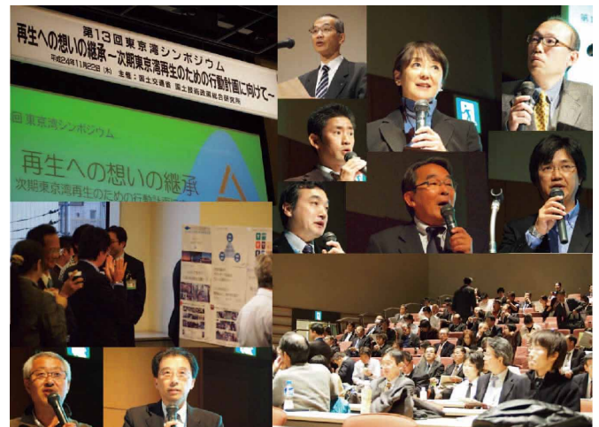
第 13 回東京湾シンポジウムのスナップ