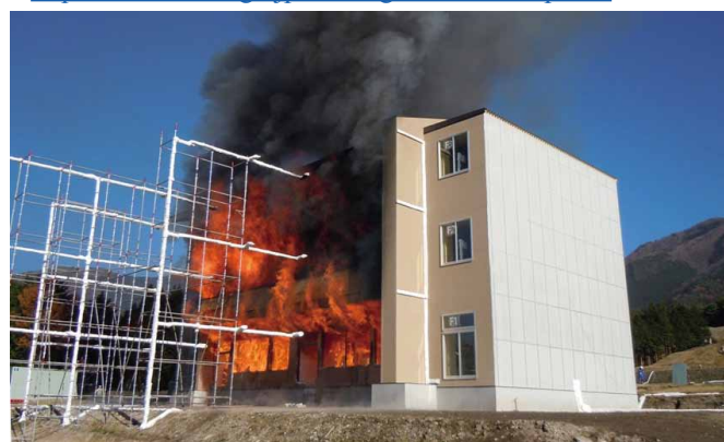
1階と2階に火災が拡大した点火後137分時点の様子

・「木造3階建て学校の火災安全性に関する研究」HP http://www.nilim.go.jp/lab/bbg/kasai/h23/top.htm