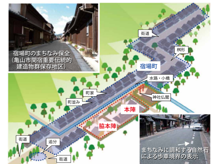
図 宿場町に由来する都市の歴史資源や構造と歴史まちづくりの具体的な方法の例

そこで当研究室では、幅広く歴史まちづくりに取り組む地域、または構想、模索している地域に、取り組みのきっかけや具体的な方法に関する情報を提供するため、「歴史まちづくりの手引き(案)」を作成しました。