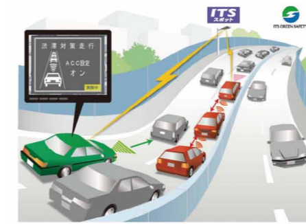
「高速道路サグ部の交通円滑化サービス」のイメージ