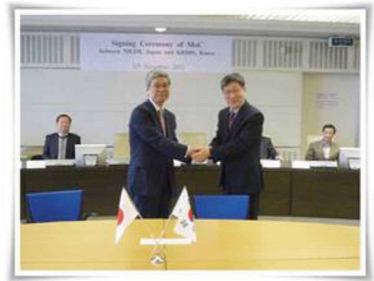
研究協力覚書の調印式(2012年11月)

韓国では、ソウル市の南約 160km の地において、中央省庁の移転による新しい行政中心複合都市世宗(セジョン)の建設が佳境に入っています。昨年末に国土交通部(日本の国土交通省に相当)や企画財政部(財務省に相当)などが庁舎を当地に移転し、業務を開始しました。