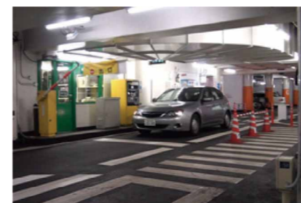
車利用型 EMV 決済の実験の様子

「高速道路サグ部の交通円滑化サービス」では、高速道路サグ部(道路勾配が上り方向へと次第に変化する区間)における交通流を円滑化するためのサービスについて、デモンストレーションを行います。デモンストレーションでは、ACC (Adaptive Cruise Control: 車速や車間を一定に維持する技術)と ITS スポットとの連携により車間時間を適正化するサービスや、CACC (Cooperative Adaptive Cruise Control: ACC に加え車車間通信により精密に車間距離制御を行う技術)と ITS スポットとの連携によるスムーズな隊列走行を首都高速道路上で体験していただきます。