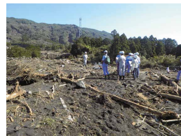
写真 災害状況の把握

災害後に東京都の設置した「伊豆大島土砂災害対策検討委員会」に、危機管理技術研究センター長が行政委員として参加し、今後の伊豆大島における土砂災害対策の基本方針及び対策案についてとりまとめるための復興に向けた技術的協力を行っています。