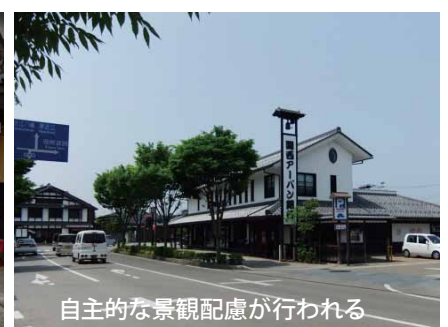
自主的な景観配慮が行われる