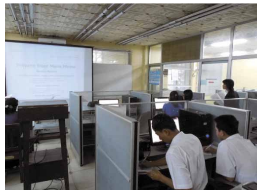
写真 ミャンマーでの港湾 EDI 操作手順の説明会

ミャンマー政府のこの取り組みに日本政府は協力しており、国土交通省としても港湾関係手続の電子化への取り組みを支援しています。その一環として、ミヤ