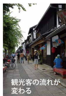
観光客の流れが変わる