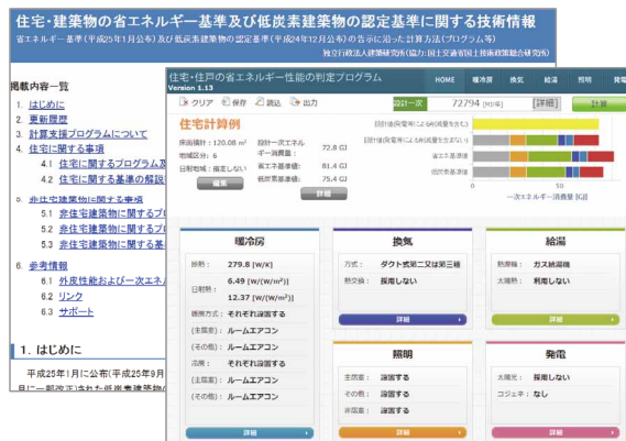
図 ホームページ(左奥)と Web プログラム(右手前)の例

詳細 ◀ 住宅・建築物の省エネルギー基準及び低炭素建築物の認定基準に関する技術情報 ((独)建築研究所 HP) http://www.kenken.go.jp/becc/index.html