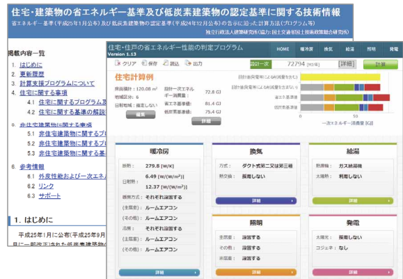
図 ホームページ(左奥)と Web プログラム(右手前)の例

詳細 ◀ 住宅・建築物の省エネルギー基準及び低炭素建築物の認定基準に関する技術情報 ((独)建築研究所 HP) http://www.kenken.go.jp/becc/index.html