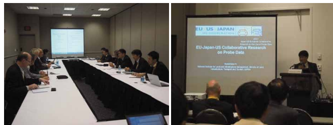
写真 個別会議・特別セッションでの発表の様子

今後、本会議で得られた情報も参考として、道路利用者のために、路車間サービスの実用化で先行する日本の ITS を、さらに高度化・普及させるための調査研究開発を進めていきます。