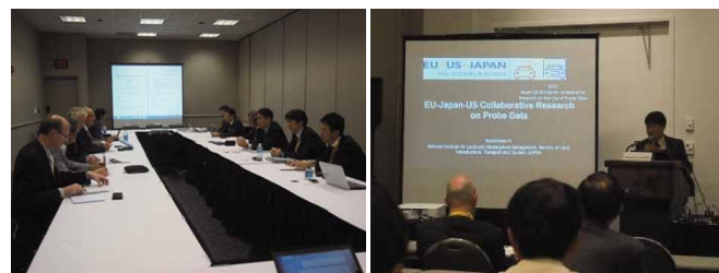
写真 個別会議・特別セッションでの発表の様子

今後、本会議で得られた情報も参考として、道路利用者のために、路車間サービスの実用化で先行する日本の ITS を、さらに高度化・普及させるための調査研究開発を進めていきます。