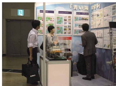
写真 ブース出展の様子

今後も、積極的に多くのイベント参加を行い、研究成果の発表や紹介を行う等、積極的な広報広聴活動に努めていきます。