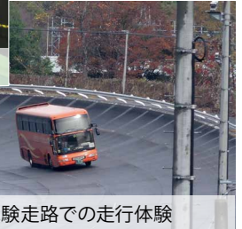
試験走路での走行体験