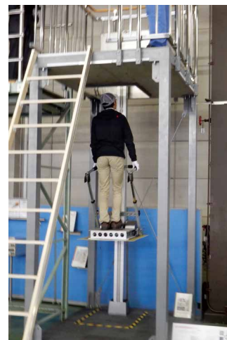
写真2 開発中の試作機 (リフト型)