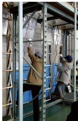
写真1 従来型の避難器 (はしこ型)

なお、成果は速やかに中間報告として国総研研究報告や学会の大会梗概などで公表すると共に、開発中の避難支援装置などは、実験場の公開などを通じて広く社会に認知して頂く様に努めたいと考えています。