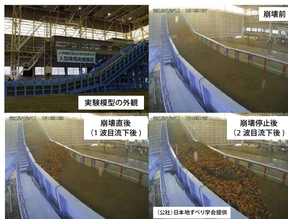
写真 実験模型と崩壊の様子

地すべり学会が行っている本実験の詳細分析を踏まえ、土砂災害研究室は、本実験の成果等を将来の土砂災害警戒情報の精度向上や施設整備等、全国での土砂災害対策に役立てていきたいと考えています。