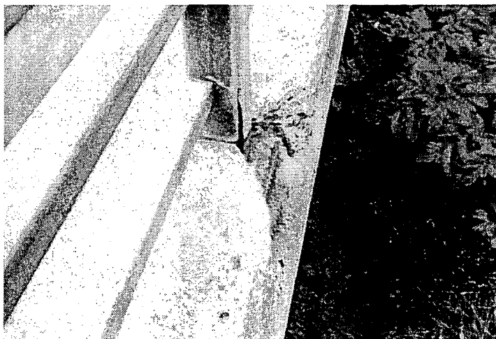
付属写真2 凍害による損傷（一例）

水の凍結による体積膨張はコンクリート内部に引っ張り力を生じさせ、引張強度の低いコンクリート構造物には表面の剥離、内部の骨材周りのセメントペーストの緩み、ひび割れなどが生じる。緩んだ部分にはさらに水が供給が供給されやすくなり、凍結と融解が繰り返されることによって、コンクリートが表面から劣化していくことになる。