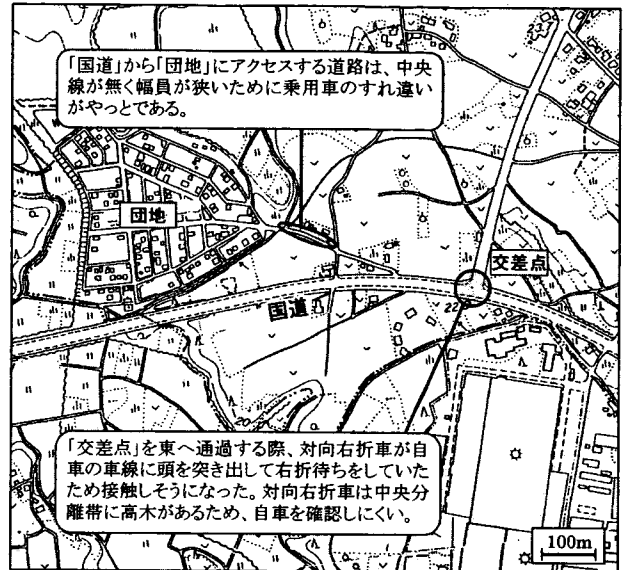
図-1 ヒヤリ地図のイメージ

るため、旧建設省土木研究所道路部の職員と、高齢者(65歳以上)の方に協力して頂き、ヒヤリ地図作成を試行しました。この調査では、単に「ヒヤリ」、「ハッ」とした場所や状況を記入するだけでなく、「ヒヤリ」、「ハッ」としないために、普段から気をつけている場所や状況も指摘してもらいました。その結果61人から延べ276箇所の指摘を受けることができました。