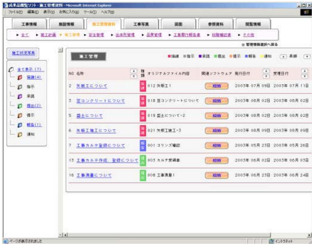
図 5-59 施工管理資料