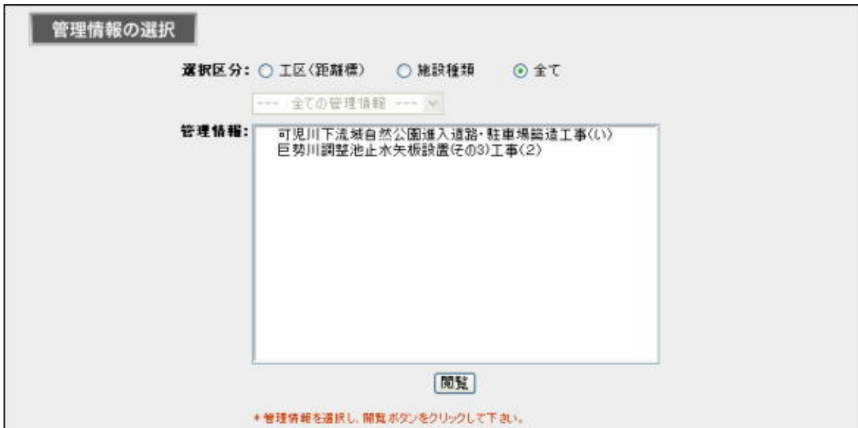
図 5-57 管理情報の選択