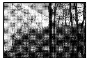
写真-2 擁壁工付近の湿地環境の状況 [R236 帯広尾道路]

各種調査結果より、保全対象の湿地環境は概ね良好な状況であった。これは、改変面積の最小化(構造物の採用、線形見直し)を図ったこと、水路や池の造成、移動経路・生息場の確保等を、個々の現場状況に合わせて実施したことに加え、適正な管理を(雑草や樹木の除去等)していることによるものと推察される。