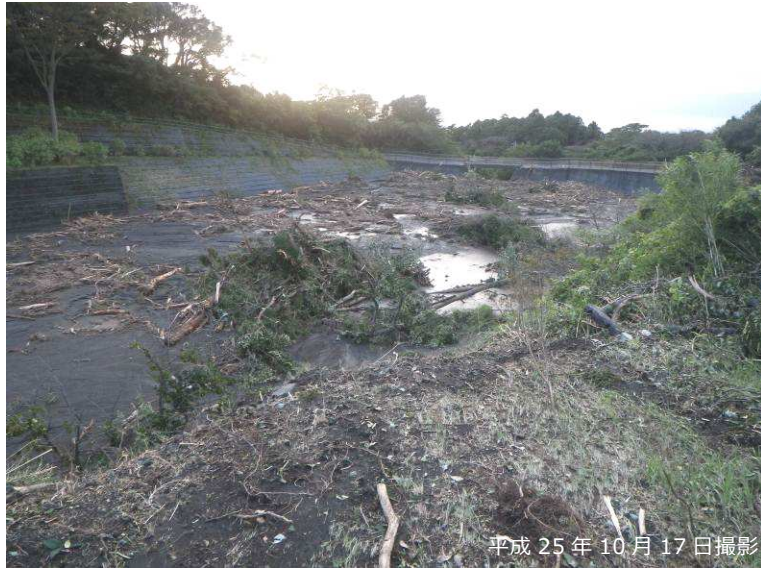
写真 3.2.14 堆積工による土砂・流木捕捉状況

平成 25 年 11 月 1 日時点では、部分的に除石が行われていたものの、大部分の堆積物は災害後の状況を留めていたと考えられる。鋼製スリット部では、前面に流木の幹・枝・根が絡み合い閉塞しており、その間を細粒の火山灰が埋めるような形で土砂・流木が捕捉され、明瞭な巨礫の捕捉は認められなかった（写真 3.2.15）。