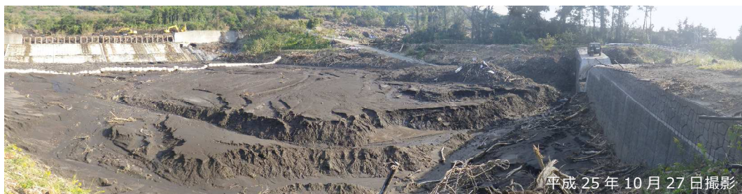
写真 3.2.8 堆積工による細粒土砂捕捉状況

大金沢堆積工直下流の溪流保全工では、明瞭な土砂・流木の堆積は認められず、溪流保全工からの越流痕跡も認められなかった（写真 3.2.9）。当該区間を流下した土石流は、大金沢堆積工で概ね捕捉され、下流砂防堰堤を越流した土砂流等は溪流保全工内を安全に流下した