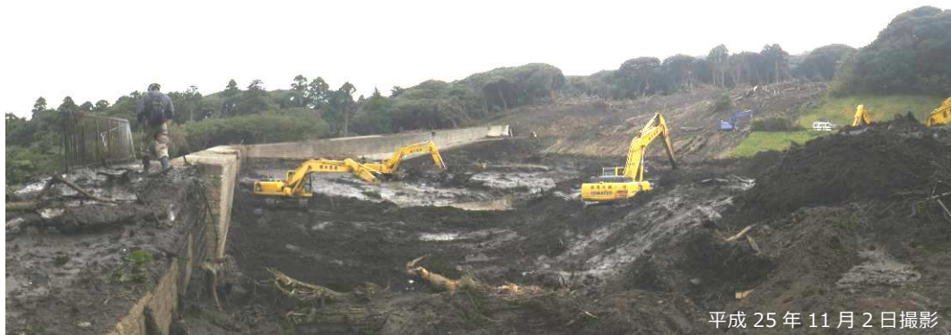
写真 3.2.23 長沢砂防堰堤での土砂・流木の捕捉

砂防堰堤左岸側を一部の土砂・流木が乗り越え、堤体上部に設置された管理用道路のフェンスが流失・倒伏していたが、堰堤下流 50m 程度の範囲で停止している状況が確認された。また、砂防堰堤下流の溪流保全工では、越流痕跡もほとんど認められなかったことから、大半の土砂・流木は当該施設で捕捉されており、下流への被害が防止・軽減されたものと考えられる。