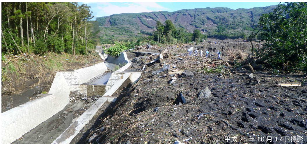
写真 3.2.10 溪流保全工への左岸側からの土石流流入状況