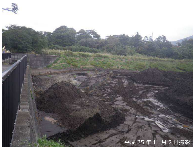
写真 3.2.21 八重沢堆積工の下流端砂防堰堤の水通し部付近

しかしながら、八重沢堆積工より下流では、島の周回道路である都道 208 号線と八重沢の交差部分において、堆積工を通過した細粒土砂による流下断面の閉塞により、氾濫及び家屋・事業所への土砂流入による被害が生じている（写真 3.2.22）。