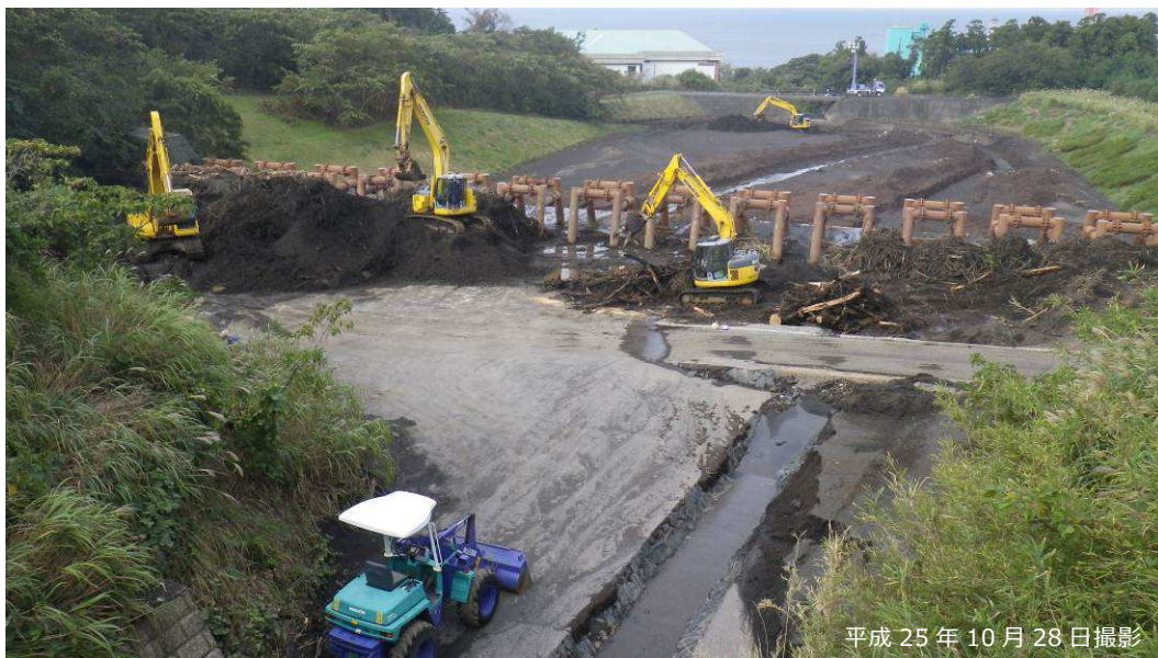
写真 3.2.19 八重沢堆積工（鋼製スリット部）の除石・除木作業状況

平成 25 年 10 月 28 日時点の踏査では、除石・除木作業が行われていたが、堆積土砂等の状況から、八重沢 P-4 砂防堰堤と比較すると明らかに流木は少なく、細粒土砂（火山灰）の堆積が主体であることが認められた（写真 3.2.19、写真 3.2.20）。