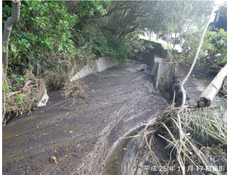
写真 3.2.22 八重沢と周回道路交差点の閉塞状況