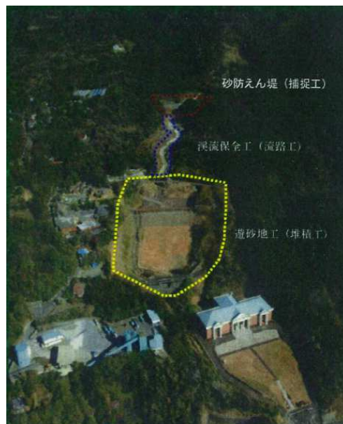
写真 3.2.3 伊豆大島総合溶岩流対策事業（八重沢）

堆積工が H13 に完成し、その後 H17 から砂防堰堤の整備を進めてきた。H19 年度末に砂防堰堤が完成し、八重沢の土砂整備率は 67% となった。