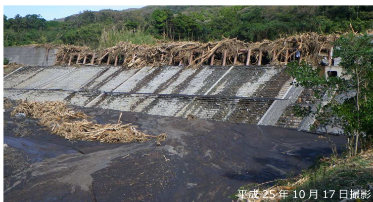
写真 3.2.5 鋼製スリットによる流木の捕捉状況

災害発生翌日 (平成 25 年 10 月 17 日) の踏査では、当該施設において大量の土砂・流木が捕捉されている状況が認められた。特に透過型堰堤の鋼製スリット部における大量の流木捕捉が特徴的であり、下流堆積地では細粒土砂 (火山灰) の堆積が顕著であった (写真 3.2.5, 写真 3.2.6)。