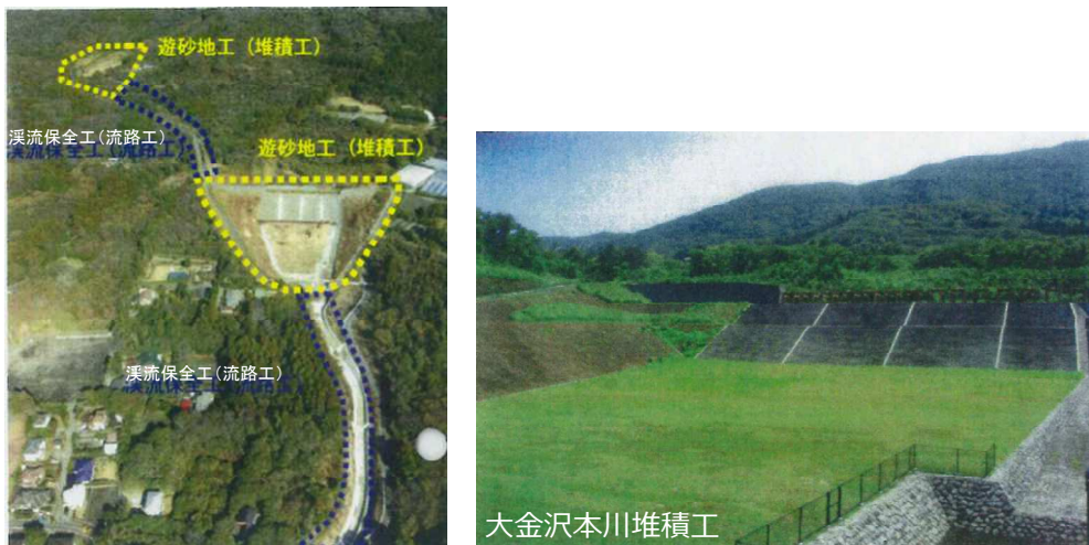
写真 3.2.2 伊豆大島総合溶岩流対策事業（大金沢）

大金沢は元町地区を流域下にもち、保全対象が最も多く、土石流氾濫予想区域に小学校があるなど、早期に整備が必要な溪流である。平成2年度から整備を進め平成19年度末に本川堆積工が完成し土砂整備率は64%となった。平成20年度から平成22年度で溪流保全工を実施した。