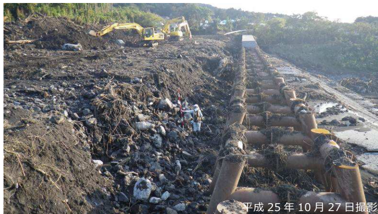
写真 3.2.7 捕捉された土石流の堆積物

以上の状況から、土石流の先端部と推測される巨礫や流木が鋼製スリット部を閉塞したことにより、上流堆積地での土石流捕捉が促進され、越流した土砂流に含まれる細粒土砂は下流堆積地で大量に捕捉されたと推察される。