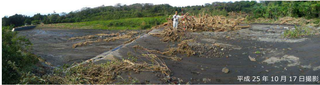
写真 3.2.6 大金沢本川堆積工による土砂・流木捕捉状況

災害発生 11 日後（平成 25 年 10 月 27 日）の踏査時には、鋼製スリット部の除石・除木、下流堆積地の除石・横断方向への土嚢積みが行われていた。