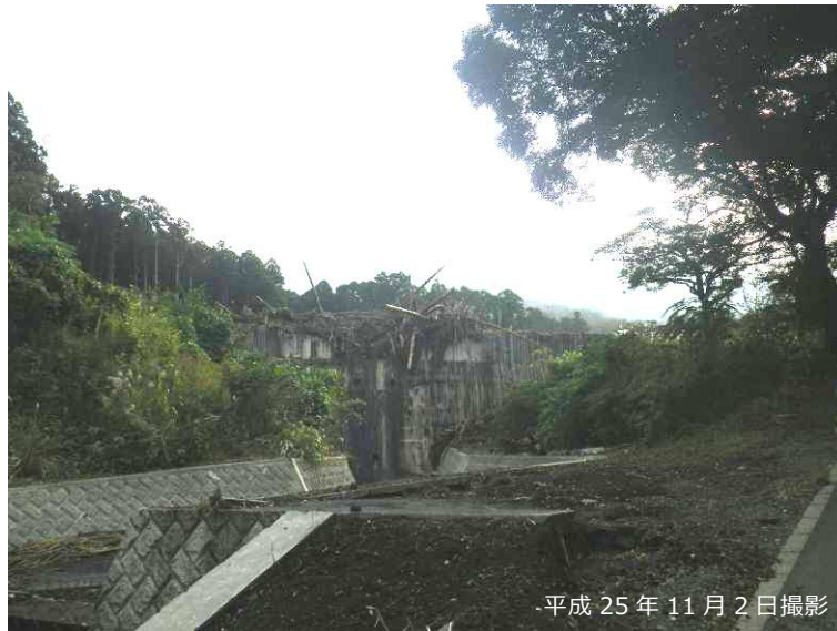
写真 3.2.16 八重沢 P-4 砂防堰堤

また、八重沢 P-4 砂防堰堤下流では、砂防堰堤を乗り越えた土砂・流木が屈曲部等で集積している状況が認められた（写真 3.2.18）。