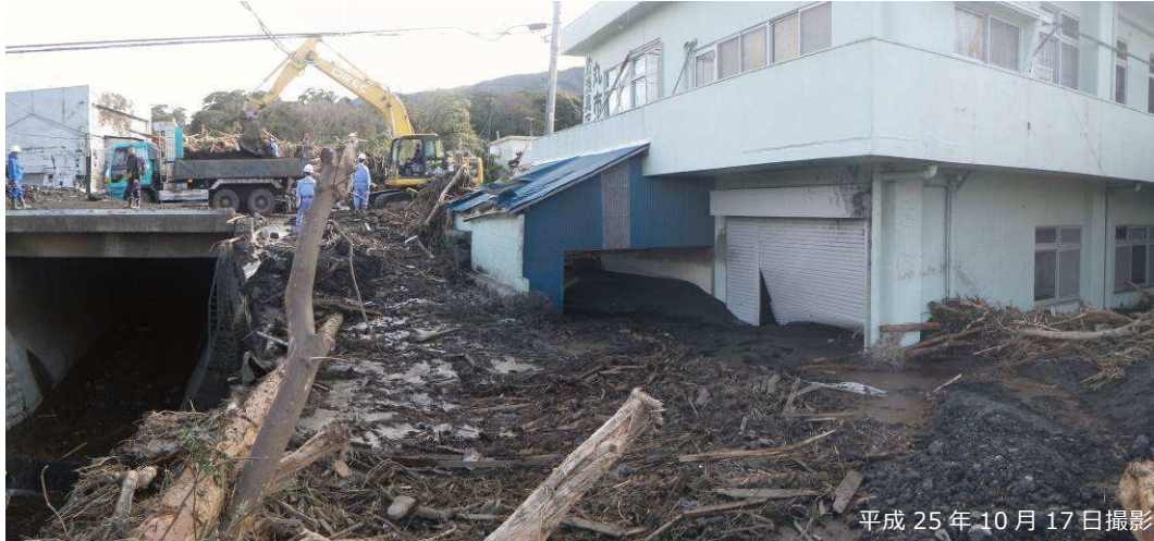
写真 3.2.12 元町地区内（大金沢と周回道路との交点付近）の被災状況