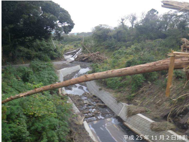
写真 3.2.18 八重沢 P-4 砂防堰堤下流の溪流保全工の状況