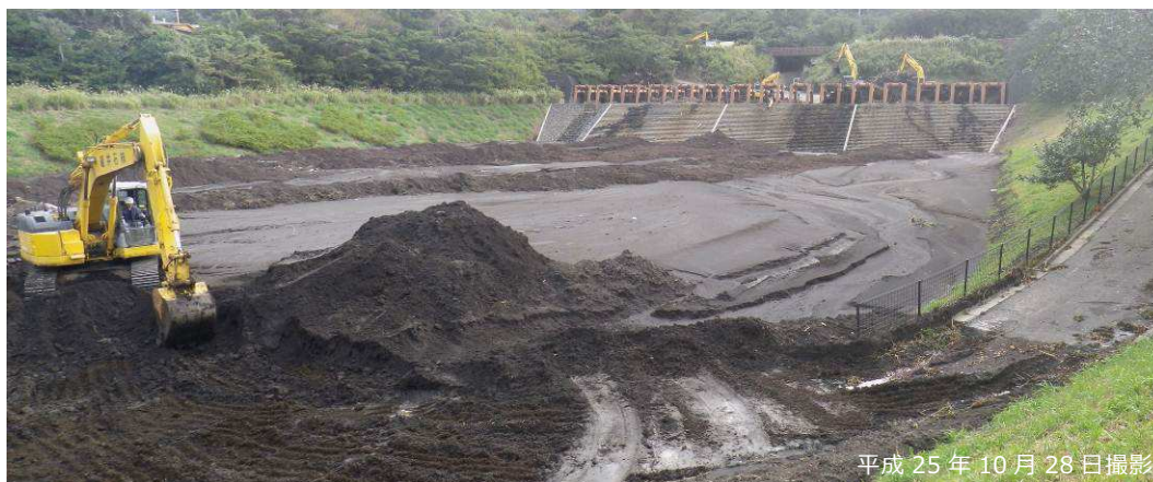
写真 3.2.20 八重沢堆積工（堆積地内）の除石・除木作業状況

また、下流堰堤の水通し付近の堆積地内に設置された金属製のフェンスが倒れず存在していた（写真 3.2.21）。これは、八重沢 P-4 砂防堰堤および八重沢堆積工の上流透過型堰堤において大半の土砂及び流木が捕捉されたため、フェンスを倒すほどの流体力・衝撃力が生じる土砂・流木の流出は生じなかったものと推察される。以上のことから、八重沢 P-4 砂防堰堤及び八重沢堆積工により、下流における被害を軽減したものと考えられる。