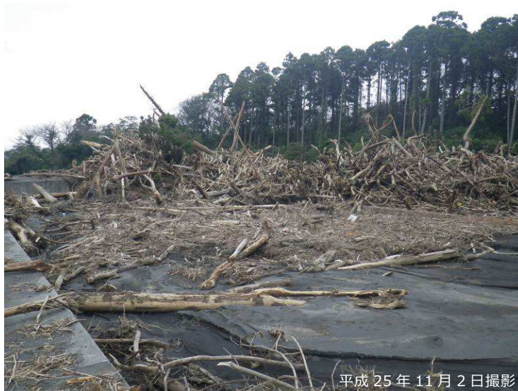
写真 3.2.17 八重沢 P-4 砂防堰堤の土砂・流木捕捉状況