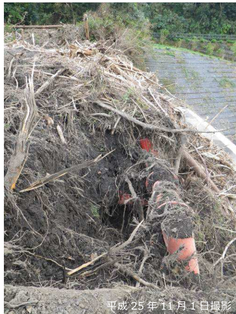
写真 3.2.15 鋼製スリット部の土砂・流木捕捉状況

以上の状況から、流入した土石流は主に細粒土砂と流木で構成されていたと推察され、当該施設により大半の土砂・流木が捕捉され、下流への流出は限定的であったと考えられる。