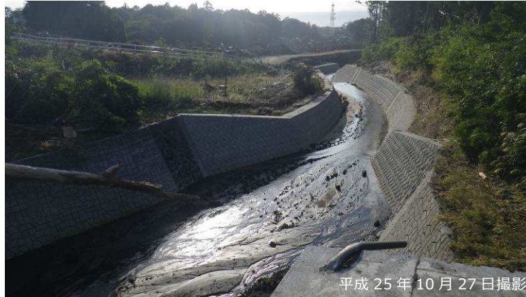
写真 3.2.9 大金沢本川堆積工直下流の溪流保全工の状況

しかしながら、さらに下流区間において、神達地区に甚大な被害を与えた土石流が左岸側から流入し（写真 3.2.10）、流木等により橋梁部が閉塞した結果（写真 3.2.11）、下流の元町地区への氾濫被害が拡大し、甚大な人的・家屋被害が発生した（写真 3.2.12）。