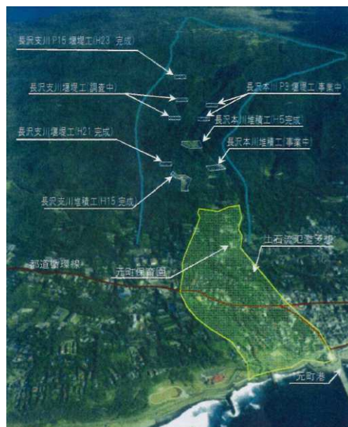
写真 3.2.4 伊豆大島総合溶岩流対策事業 (長沢)

昭和 61 年の割れ目噴火に伴い流出した溶岩により, 流路が埋塞され, 災害復旧事業により流路の付替え及び堰堤 (本川堆積工) が整備された。その後も支川堆積工の整備を進め H15 に完成したが, 土砂整備率は 32% と低い状況にある。また, 長沢は元町地区を流域下にもつ溪流で保全対象も多いため, 捕捉工を施工中である。