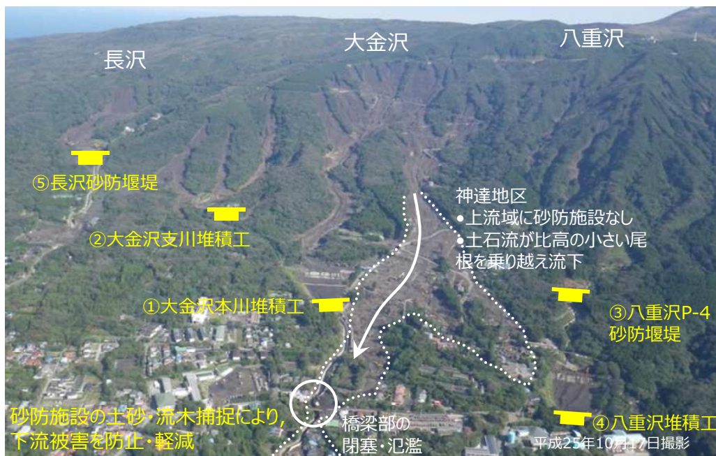
写真 3.2.1 土石流発生状況と砂防施設配置状況