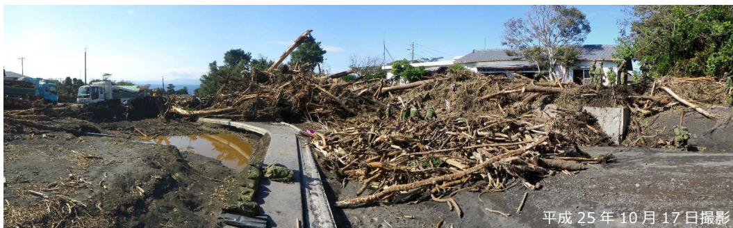
写真 3.2.11 橋梁部の閉塞に伴う溪流保全工内の土砂・流木堆積状況