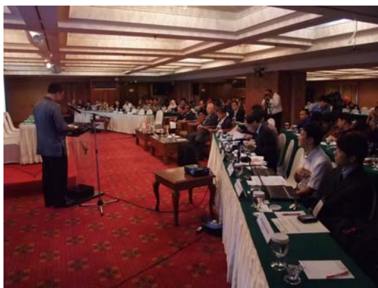
セミナー会場の様子