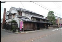
木之本宿に残る町家

交通の要衝であった長浜には、複数の宿場町があった。なかでも北国街道木之本宿は、浄信寺の門前町としても発展してきた。現在でも宿場町の面影を残し、参詣者の往来が絶えない。