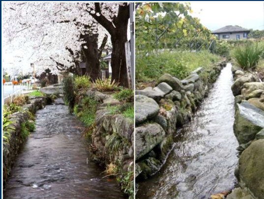
雄川堰（左：大堰／右：小堰）

小幡のまちに網目状に張り巡らされている「雄川堰（大堰及び小堰）」の石積改修や洗い場の整備工事を行う。