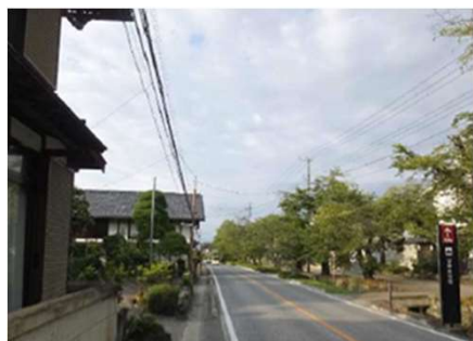
無電柱化を予定している町家地区

歴史的建造物が数多く残る町家地区の無電柱化及び、「楽山園」周辺の町道の美化や道路改良整備を行う。