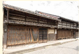
吉久伝統的建造物群保存地区 ▶

重要伝統的建造物群保存地区である山町筋、金屋町、吉久において、伝統的建造物の修理や非伝統的建造物の修景事業を実施し、歴史的な町並みの保全を図るものである。