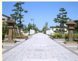
ストリート構想に位置付けられている通り ▶

ストリート構想に位置付けられている通りにおいて、関係する歴史的風致を堪能できるようなルートを設定し、最新技術等を用いてその地域の歴史や文化に触れる機会を提供することで、「歩いて楽しいまちづくり」の推進を図る。