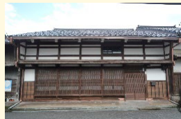
歴史的風致形成建造物の例 ▶

登録有形文化財をはじめとする市内の町家等を歴史的風致形成建造物に指定し、修理を実施し、歴史的建造物の保存と活用を図るものである。