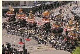
高岡御車山祭の様子 ▶

重要有形民俗文化財である「高岡御車山祭」の山車は、金工技術や漆工技術などの工芸技術が結集したものである。この山車について保存修理を実施し、それらの工芸技術等の継承につなげるものである。