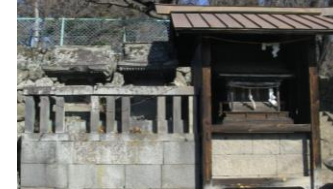
西宮八坂神社 (祢津健事神社横)