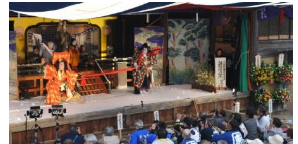
歌舞伎公演の様子 (東町)