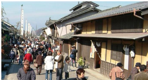
白鳥神社例祭の様子