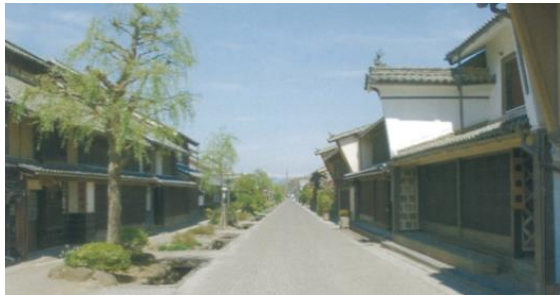
海野宿のまちなみ

また、江戸時代に起きた災害を機に行われるようになった白鳥神社例祭や灯籠回しが続けられており、まちなみと地域の風習との深い関わりからは、人々の郷土に対する想いの深さがうかがえる。