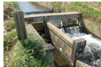
八重原用水 中八分水榭