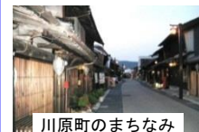
川原町のまちなみ

川湊が置かれた川原町には、水運により運ばれた和紙や竹などを活かした伝統工芸が生まれた。今もそこには、岐阜うちわの製造販売を続ける商店や紙問屋が残っており、川湊の名残を感じることができる。