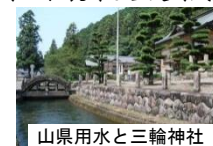
山県用水と三輪神社

鎌倉初期に開削された山県用水の管理には、今も三輪神社の氏子達が深く関わっている。周囲に水田が広がるのどかな風景と、飛鳥時代に創建された三輪神社で繰り広げられる祭りの賑やかな様子が、良好な歴史的風致を醸し出している。