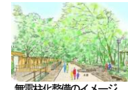
無電柱化整備のイメージ

岐阜公園内及び隣接する市道において、電線共同溝敷設による無電柱化整備を行い、景観に配慮した道路修景整備を行う。