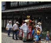
八朔祭の御神幸の様子

西宮神社の鎮座する本町地区の氏子により行われる八朔祭は、塩屋土蔵や旧竹屋書店などの歴史的建造物が残される通りの店先に日用品で造られた見立て細工が飾られる、城下町の風物詩となっています。