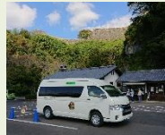
岡城登城バスの運行

城下町と岡城跡を回遊する周遊自動車等やレンタル自転車等の交通手段を構築することにより、高齢者や身障者の来訪者に対し優しい回遊ルートに構築します。