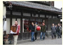
恵比寿講での町廻りの様子

早春に行われる恵比寿講は、歴史的建造物が数多く残される城下町で行われます。華やかさはないが昔ながらの町家と溶け込んだ城下町住民の繁栄を支えてきた町家の人々の住民活動の礎となる行事です。