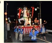
久住夏越祭の曳山車行事

8月に久住神社とその周辺地域で行われる久住夏越祭では、神輿の神幸や曳山車の「ヤマヤレ、元氣出せ」の掛け声と山車囃子の音色が、高原の町久住に夏の訪れをつける風物詩となっています。