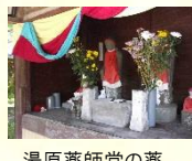
湯原業師堂の業師如来と地藏菩薩

情緒豊かな温泉郷である長湯温泉の湯原業師堂の二尊を供養し、長湯の発展と温泉に感謝する温泉供養は、法要や神輿の御神幸が行われ、湯治場長湯を象徴する歴史的風致です。