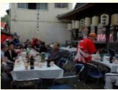
神明社の大祭の様子

5月に行われる古町地区の神明社の大祭は、神事や神楽の奉納が行われます。参拝者に寿司が振舞われることから「すし祭」とも呼ばれ、城下町の入り口として繁栄してきた古町地区の固有の歴史的風致を見ることができます。