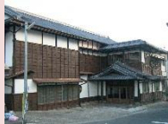
竹田市公民館竹田分館 (旧一味楼) ※整備例

竹田城下町地区における民家や店舗の所有者が、歴史的建造物等の特性を活かした協定を締結した上で屋根・外構等の建物修景を「竹田地区街並み形成景観・修景ガイドライン」に沿って行う場合に、経費の一部について補助を行います。