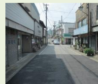
空き家・空き店舗状況

空き家や空き店舗の有効活用をととして、城下町を形成する建造物を再生し、地域の活性化及び良好な景観形成の促進を図ることを目的に、再生に必要な改修等に対し補助金を交付します。