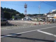
城下町回遊館建設予定地

城下町の中心部に位置した場所に、城下町を訪れる来訪者の為の案内施設及び地域住民の文化拠点施設とし、誰もが気軽に訪れ交流を深めることができ、中心市街地の賑わいを創出できるような施設整備を行います。