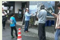
岡城跡で案内を行う子供ガイド

城下町や岡城跡で案内ガイドを行う団体に対し、統一した内容で案内を実施できるようにガイド研修や案内テキスト等を作成するなど、必要な支援を行います。