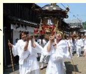
夏越祭の御神幸の様子

城原八幡社の神輿が城下町へ御神幸し城下町の3社を廻る夏越祭は、氏子である城下町の町家の人々により、江戸時代から継承されています。城下町と農村部の人々の繋がりが感じられる竹田の夏の情景です。