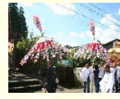
神保会行事の神幸行列

10月に宮処野神社とその周辺地域で開催される宮処野神社神保会行事では、獅子舞や白熊が先導する華やかな御神幸行列が整然とした姿で田園風景が広がる都野地区を進んで行きます。