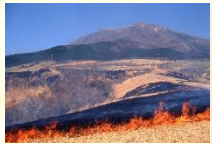
久住高原の野焼き

久住山の麓に広がる久住高原では、野焼きが行われ、牛馬の飼育に必要な草場が維持されています。広大な草地は、高原に住む人々と大自然の共生により造られたものです。