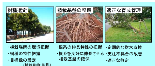
図3 台風被害を軽減するための課題