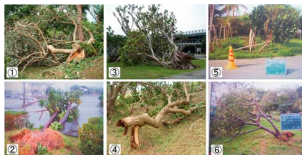
写真 1 倒木に至ると考えられた主な要因