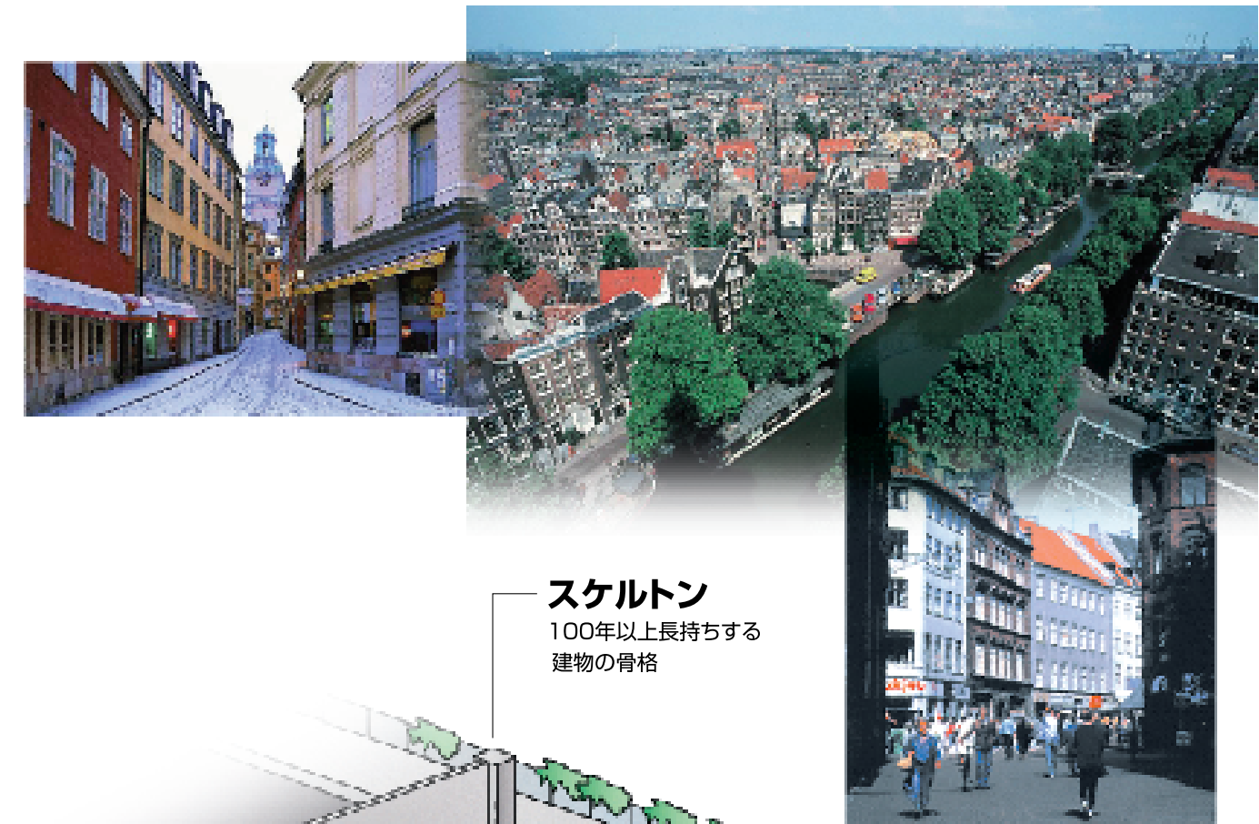
スケルトン 100年以上長持ちする 建物の骨格