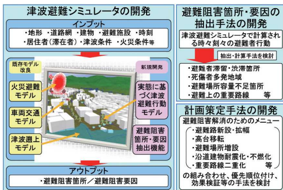
図1 津波避難安全性評価手法の開発の研究構成