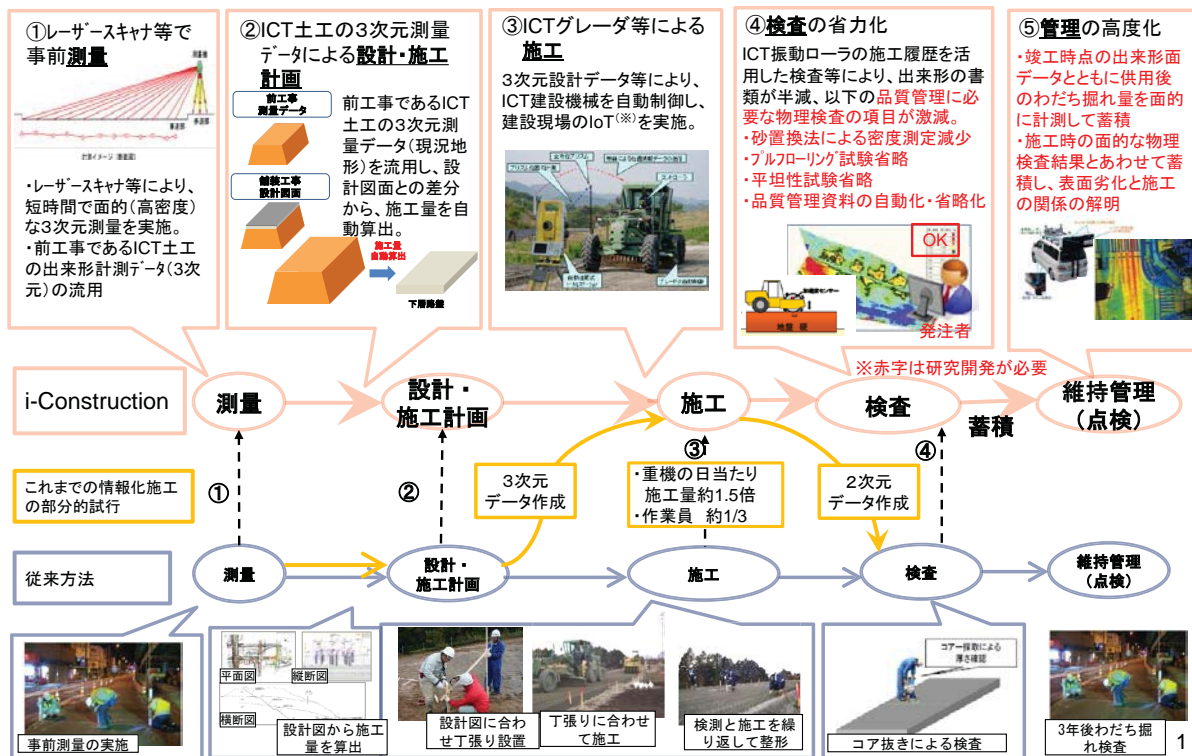
図-3 ICTの全面的な活用 (ICT舗装) のイメージ