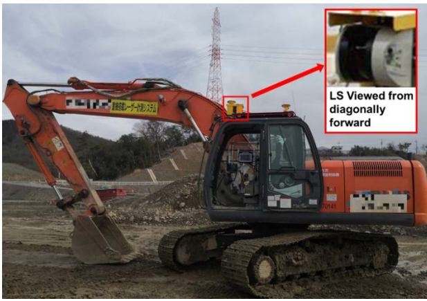
図-1 バックホウと搭載されたレーザスキャナー