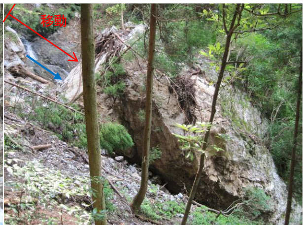
巨岩側部から見る