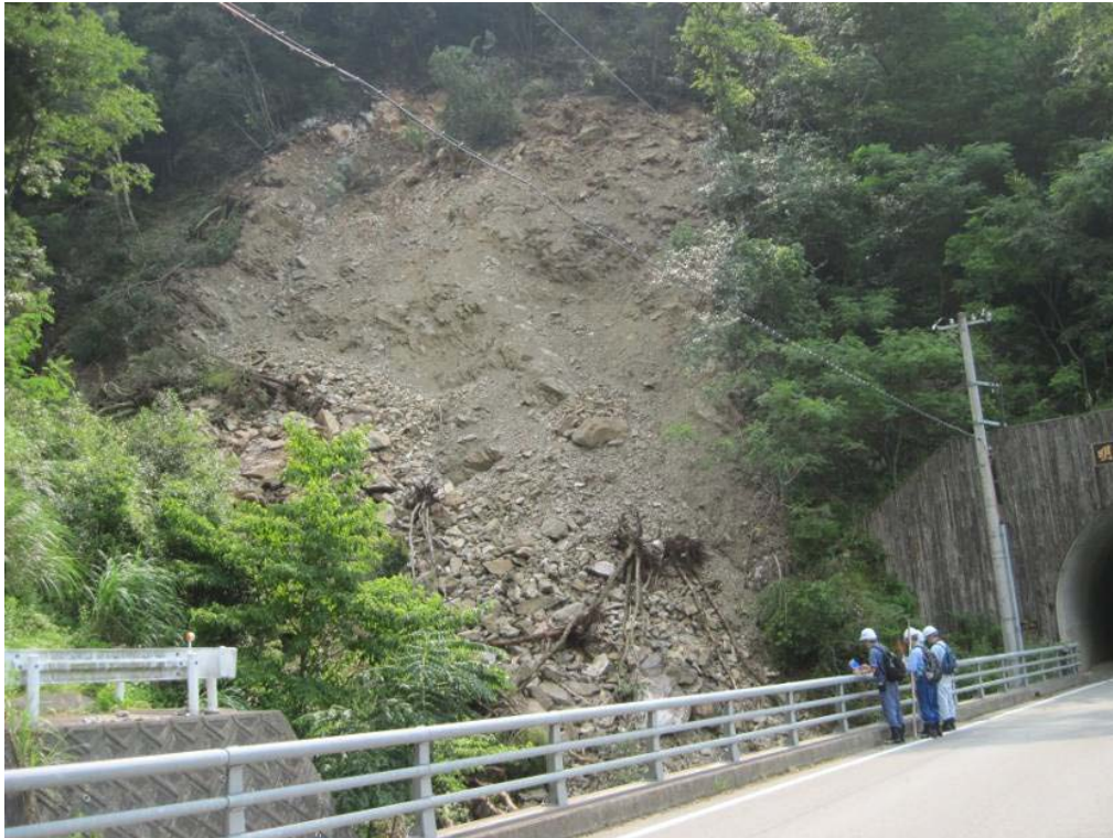
坑口側の表層崩壊