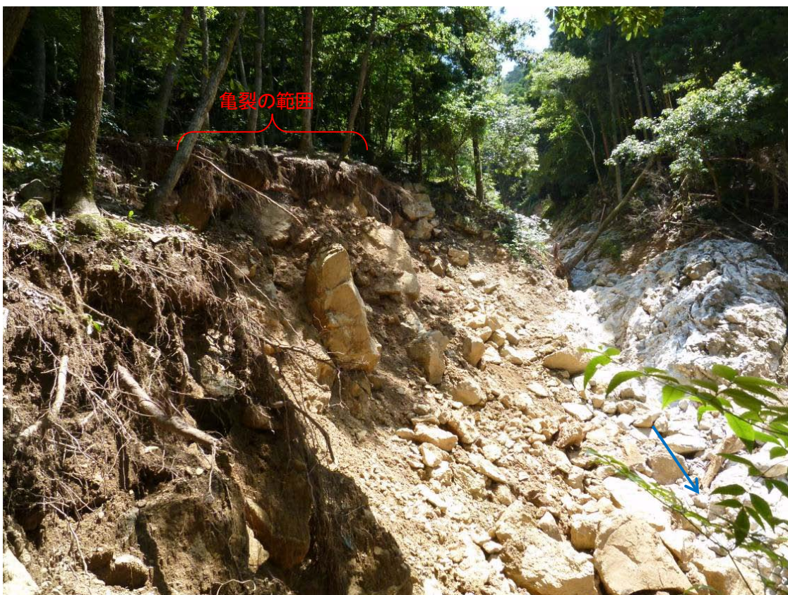
溪床の露岩と表土層