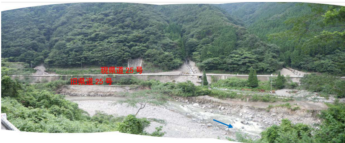
現県道 25 号下部、旧県道 25 号の侵食決壊部