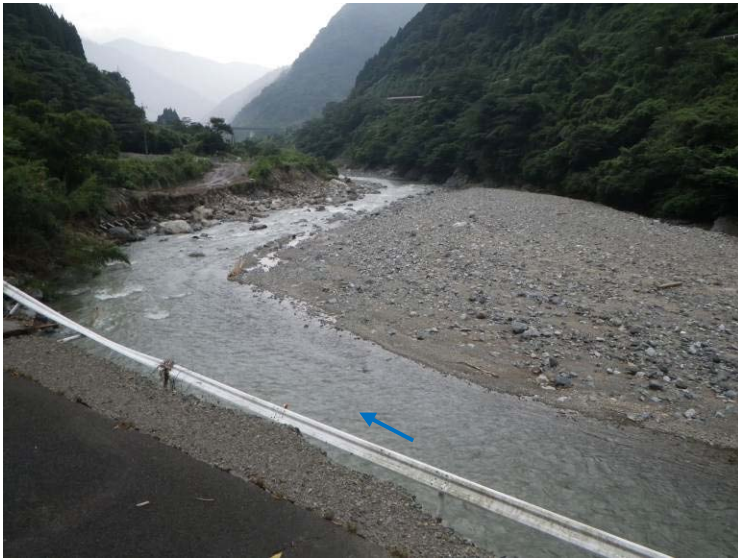
右岸側寄り洲の状況