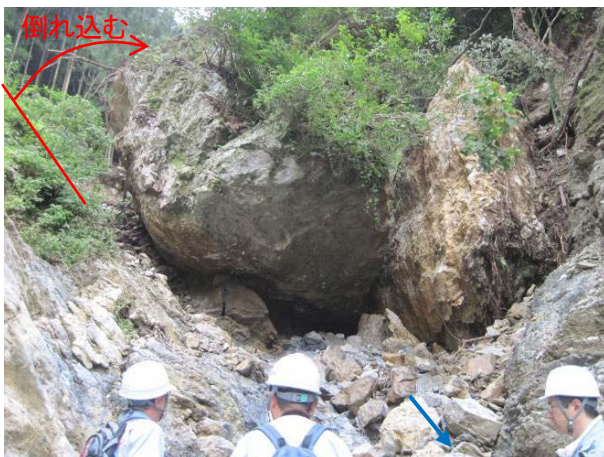
巨岩下流側から見る