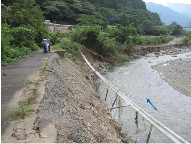
旧県道 25 号の決壊状況