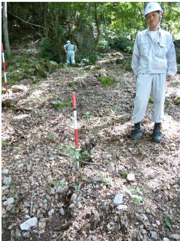
複数の引張り亀裂