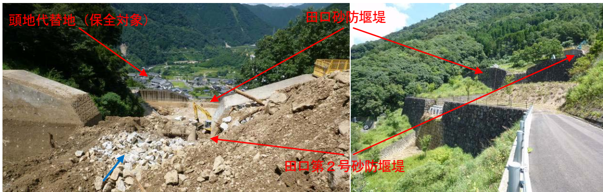
田口砂防堰堤、田口第2号砂防堰堤（上流側）