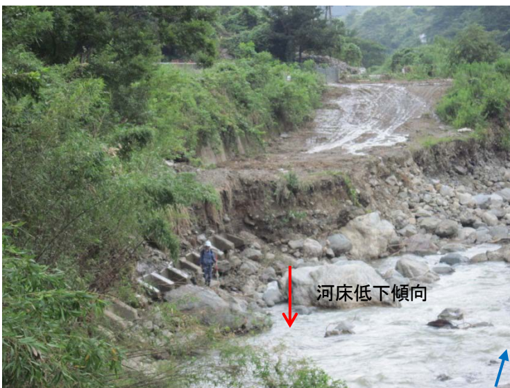
下流側根固めブロックの沈下状況