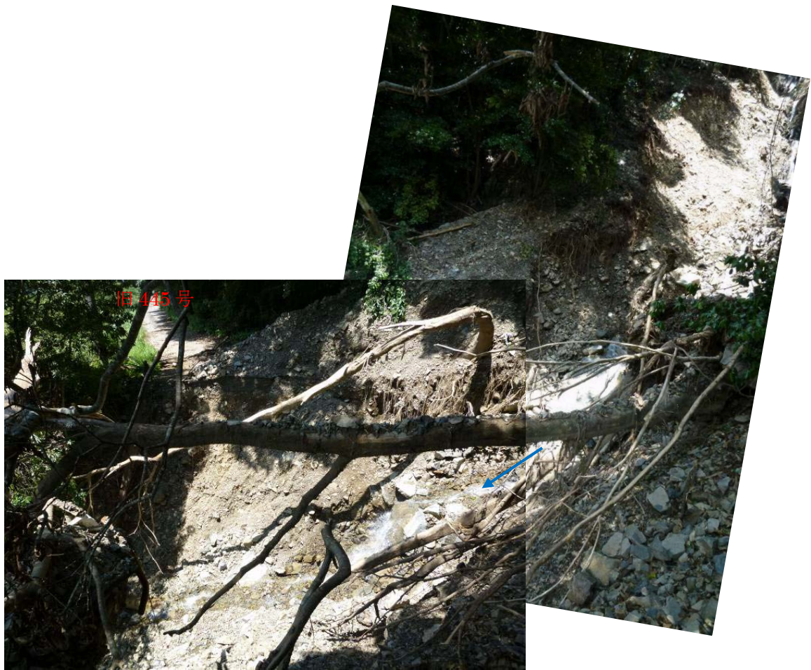
旧 445 号の侵食状況