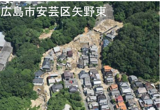
広島市安芸区矢野東