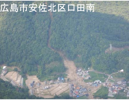
広島市安佐北区口田南

土砂災害は、その多くが最大24時間雨量が400mmを超過している範囲で発生し、おおむね南北30km、東西40kmの範囲内に分布