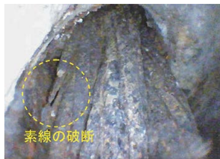
写真-5 P1付近のドリル削孔によるシース内の状況

このように、既設橋の調査では外観からの調査の限界もあり、損傷発生に関わった可能性のある要因を突き詰めて考え、それらを元に何が生じている可能性があるのかを推測していくことで効果的な調査が行えることも多くあります。特に、グラウト未充填が懸念される場合には、外観に変状のないことが腐食を生じていないことの裏付けにはならないことに注意する必要があります。