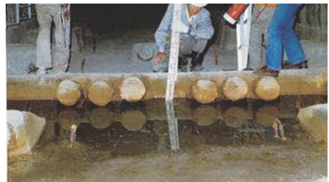
写真-2 箱桁内、桁端部付近のPC定着部と滞水状況

本橋では、過去に桁端部の開口部を通じて箱桁内に路面水が流れ込んで滞水していたこと(写真-2)、また別の箇所では、箱桁内に配置した排水管の破損によって、その周囲に滞水が生じていたこと(写真-3)が確認されています。