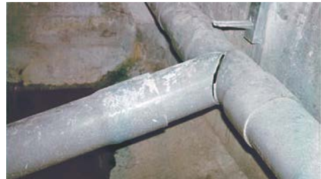
写真-3 箱桁内の排水管継手の割れと滞水