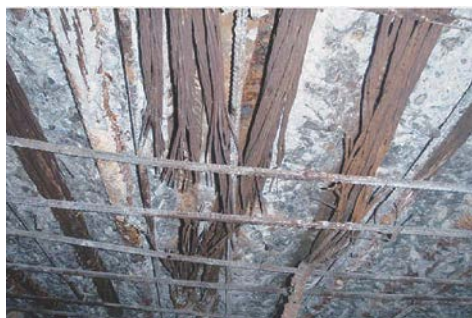
写真-4 A1-P1間現場打ち部の下床版下面はつり状況

このように、コンクリート橋で鋼材が腐食している場合、必ずしも腐食因子の侵入経路や腐食の原因が一つとは限らないこともよくあります。調査にあたっては様々な可能性を安易に排除せず、可能性のある原因を慎重に見極めて対策に漏れなく反映させることが極めて重要です。