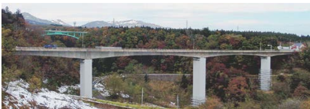
写真-1 妙高大橋の全景

妙高大橋は、写真-1及び図-1に示す、橋長300mの4径間連続ラーメンPC道路橋で、1972年に竣工しました。当時普及し始めていた、セグメント工法(分割して作られたコンクリートブロック(セグメント)を、PC鋼材で緊張してつなげ